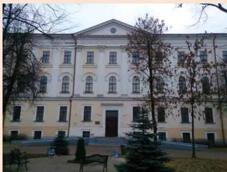
Научный отдел ФГБОУ ВО Тверской ГМУ Минздрава России 27.04.2022 г.

16:45-17:00 Завершение работы конференции.